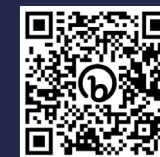
Fig. 2. Charla día del emprendimiento.

Más de 150 representantes de todo el ecosistema emprendedor valenciano asistieron a la gala donde se repasó el pasado, presente y futuro del ecosistema emprendedor universitario y las casi 200 startups que lo han conformado.